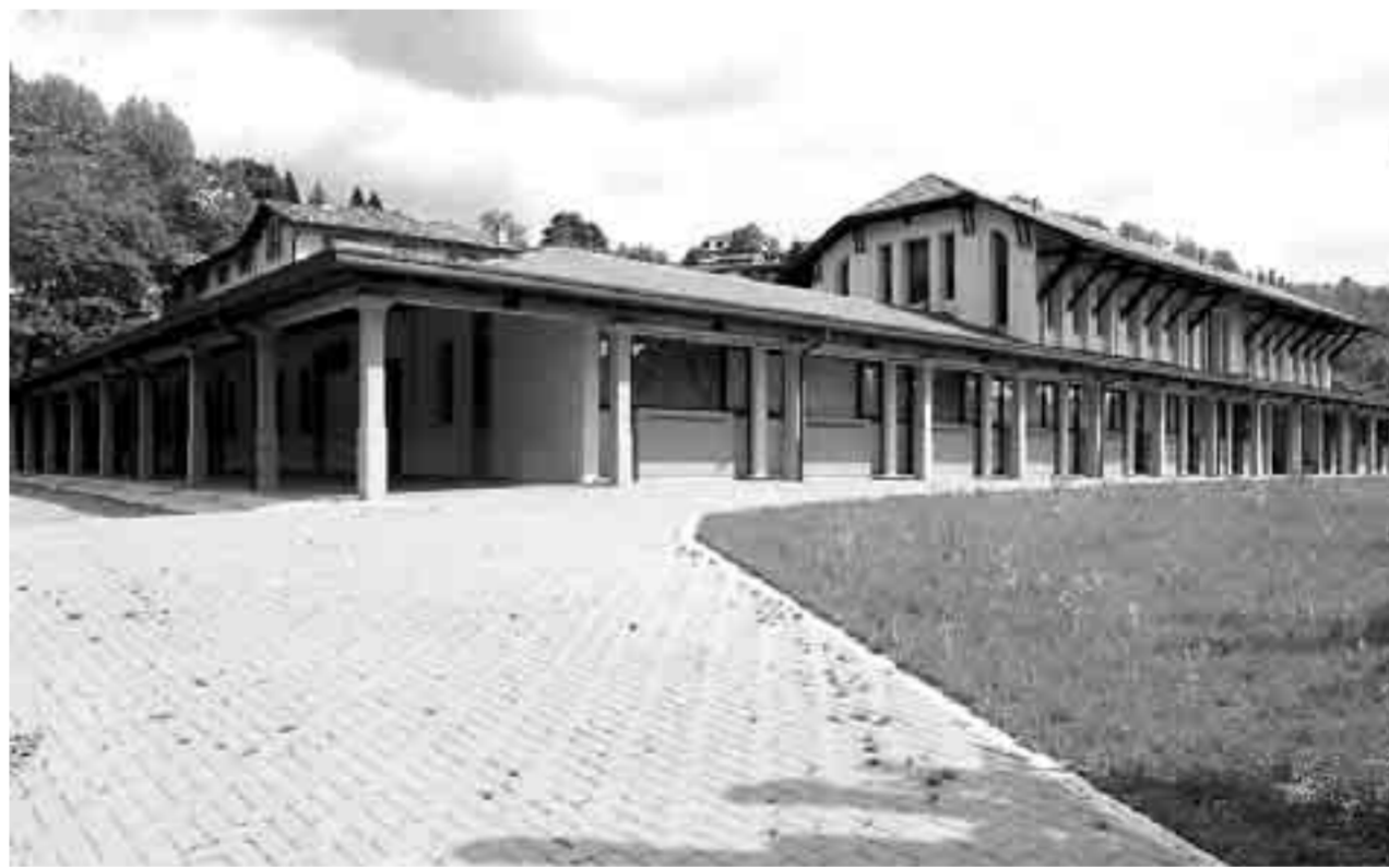
L'HOSPICE Un intervento coordinato da Asl e Regione ha permesso di trasformare le ex stalle in un moderno hospice per malati terminali di Aids

oppure mandate una mail all'indirizzo: redcronaca@laprovincia.it